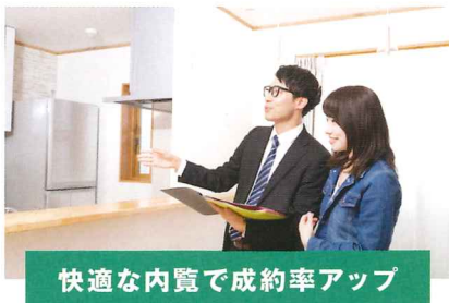
快適な内覧で成約率アップ

パナソニック ホームズ不動産の賃貸管理で 入居者に「心地よい暮らし」を、オーナーさまに「生涯満足経営」を。