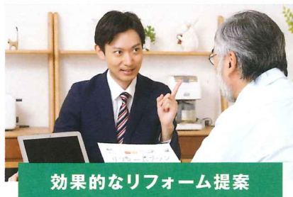
効果的なリフォーム提案