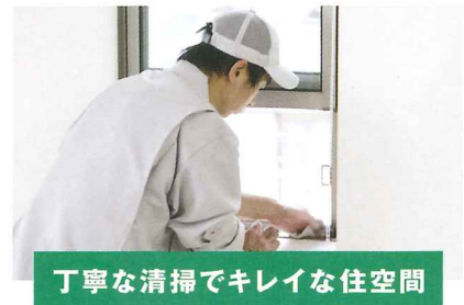
丁寧な清掃でキレイな住空間