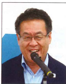
目黒区長 青木英二様

私どもといたしましては、「めぐろ青色申告会」は、申告納税制度を支える良きパートナーとして、これまで以上に協力・協調体制を推進して参りたいと考えておりますので、引き続き税務行政に対するご理解とご協力を賜りますようお願い申し上げます。