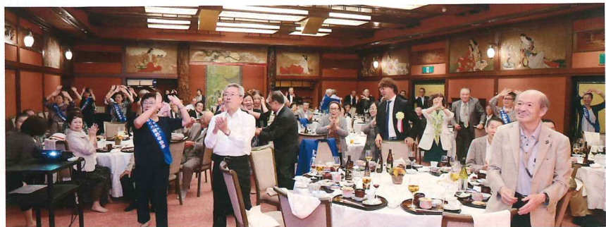
東京五輪音頭-2020-を心ひとつに踊る参加者