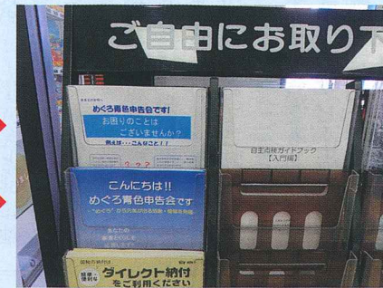
【本財団事業案内 目黒税務署へ設置】