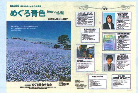
【紹介キャンペーン入会者事業紹介(A3表裏)】