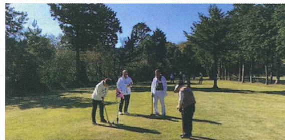
【グラウンド・ゴルフの様子】

10月29日(月)、貸切バスで出発し、千葉県君津市「ロマンの森共和国」へ。グラウンド・ゴルフ、露天風呂、道の駅「四季の蔵」日帰りの旅を37名の参加者で楽しみました。