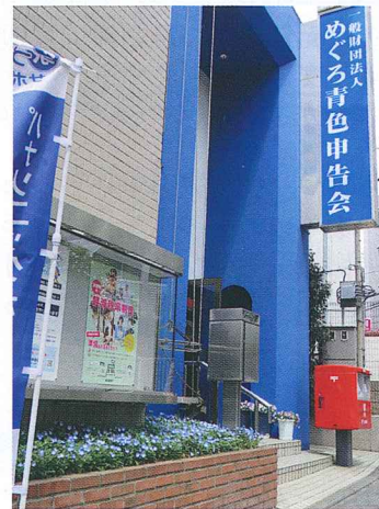
【目黒青色申告会館】