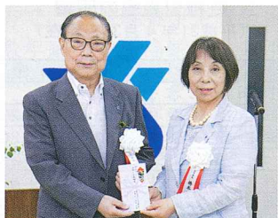
受表彰歴: 目黒税務署長感謝状、目黒税務署長表彰、都税務所長感謝状、東京国税局長表彰、区政功労者表彰、東京都税務功労者主税局長表彰

役員歴・34年間(S60)女性部会役員就任。女性部会(旧婦人部)会計、女性部会副部長、支部副部長、常任理事副会長歴任。現在副理事長、支部長、支部班長入会...108.5名勸奨(S61~H30 33年間) *役員2名で1名の入会勸奨の場合、0.5名