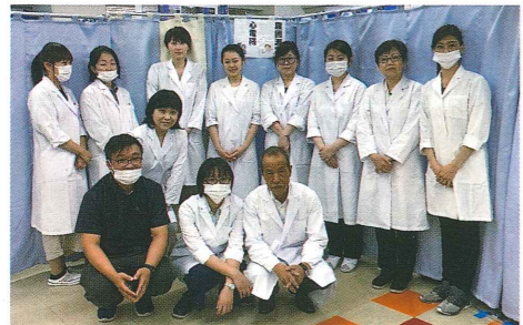
私たちが健診します (医療法人社団社友会 山口医院附属健診センター)