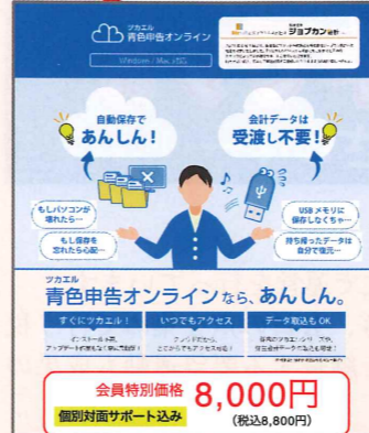
ジョブカン会計クラウド版会計ソフト

ちょっと聞きたいことがある時、税務署には聞きづらいけど、申告会の記帳サポートなら聞きやすいです。