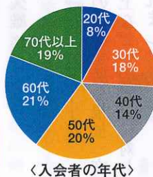
キャンペーン期間中の入会者年齢、業種区分