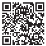
公正取引委員会ホームページ

自身が免税事業者、取引先が免税事業者の場合の対応について関係省庁連名でQ&Aが公表されています。「免税事業者及びその取引先のインボイス制度への対応に関するQ&A」