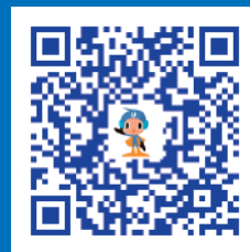
めぐろ青色申告会 ホームページ