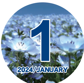
ネモフィラ「めぐろ青色申告会の花」