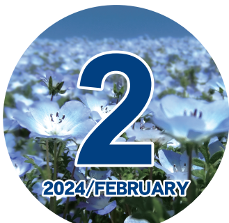
ネモフィラ「めぐろ青色申告会の花」