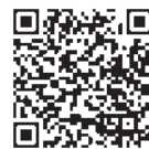
国税庁ホームページ (医療費控除を受ける方へ)