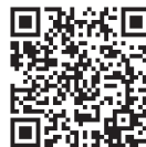
国税庁ホームページ (こんな収入の申告漏れにご注意)