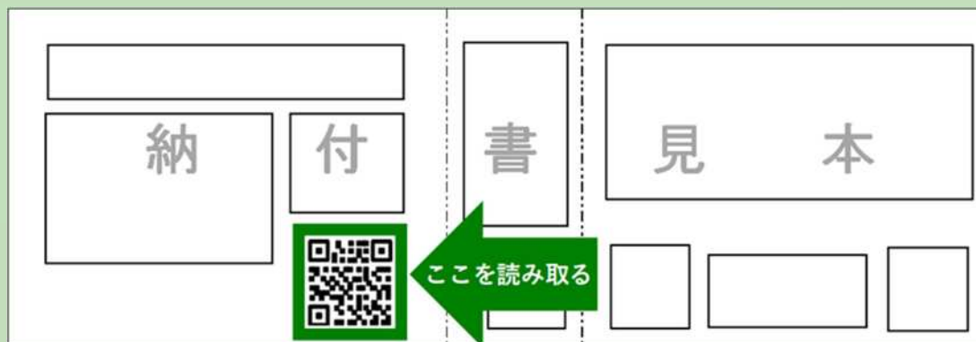
納付書の下部に eL-QR が掲載