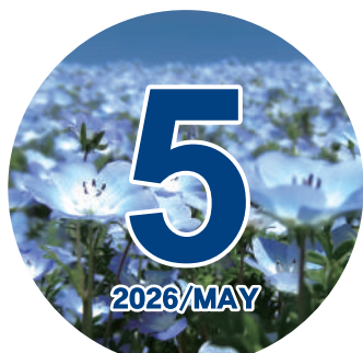
ネモフィラ「めぐろ青色申告会の花」