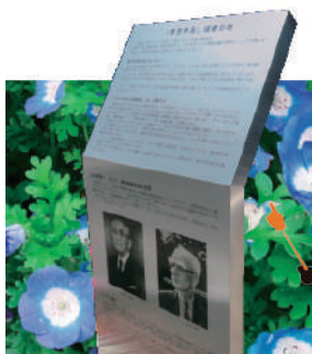
【「青色申告」端緒の地 記念碑】

たシャープ博士といった方々が、今の私たちを「青色申告」で助けてくれていたというところがよくわかりました。